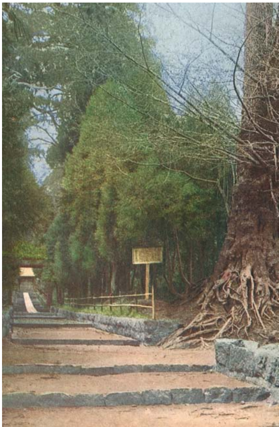
狭野神社参道(狭野の杉並木)