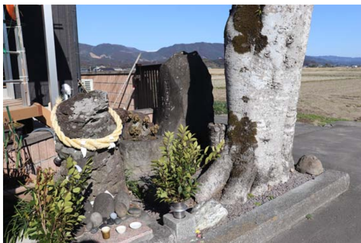
第二図 加久藤一本杉の跡(宮崎県えびの市)

付、加久藤御城下一本杉之本二本傳庵と申庵を被召立、文禄三年より同五年迄二成就仕候處、右通古今無比類被為得御勝利御帰朝被遊候付、此月為御願成就供養塚御建立有之、御名代忠元相勤、為法樂為詠和歌に御座候、 はるかなる鷺の高ねの雲ならん御法の庭の花のけしきハ