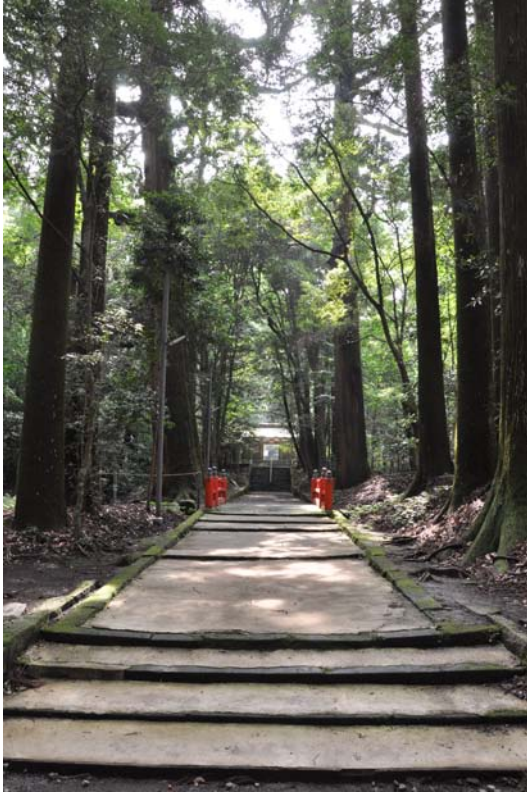
狭野神社参道(狭野の杉並木)