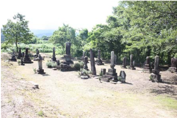
神徳院住持の墓地