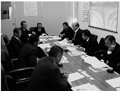
日之影町議会調査