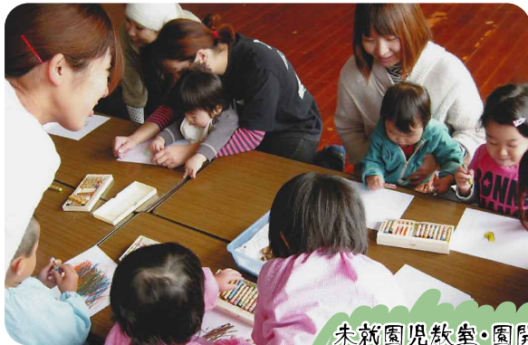
未就園児教室・園開放

遍照幼稚園は、子どもたち、親、そして先生たちにとって、『大切な学びの場』であり、そして、ほとけさまに見守られている『ありがとう』のこころを、お育ていただく場でありつづけたと思っています。