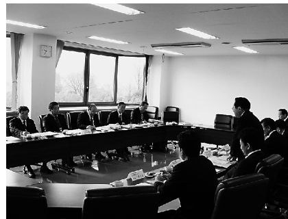
高千穂町議会調査