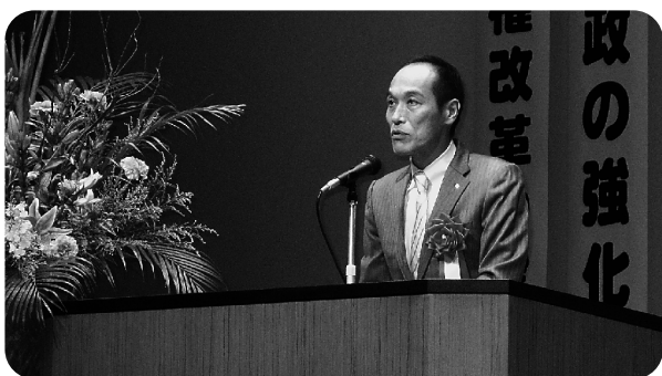
来賓あいさつする東国原知事