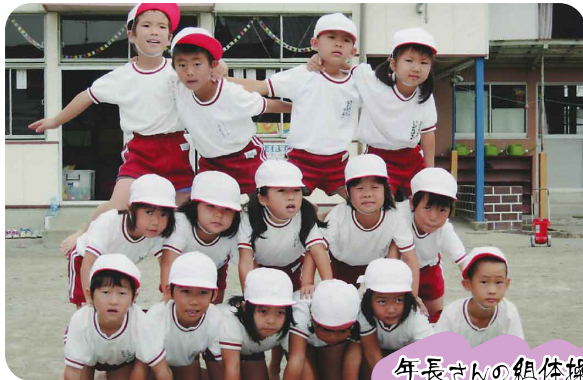
年長さんの組体操