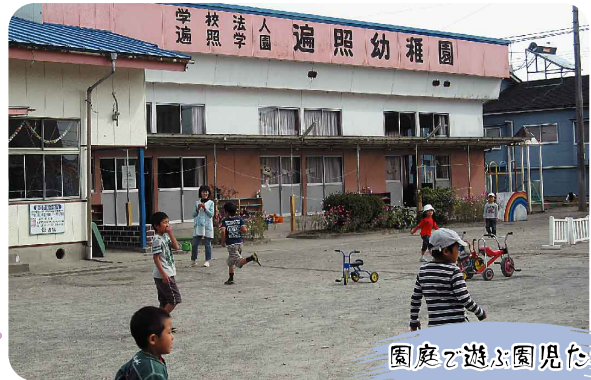
園庭で遊ぶ園児たち