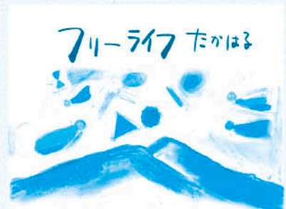
高原町ブログ始めました。よかったらご覧ください。 ※高原町役場 HP→移住の窓口 から入れます。 https://freelifetakaharu.hatenablog.com/

「こがいのの?」と、どちらにせよのハテナ攻めです。そんな私が初めて高原町を訪れたのはまだ独身の頃でした。温泉好きなのもあり、妹と車走らせ湯之元温泉へ向かう道中、その景色にわあ...と見惚れました。大きな山がどーんと構える麓に田んぼや民家がひろがる風景。こんなところで暮らせたらいいなあ...。山の神にまると守られているような土地の景色が、その後もずっと心に残っていました。それから数年後...ついこの間、同じ道を通ってふと思ったのです。...あれ? 住めてる!! (笑)