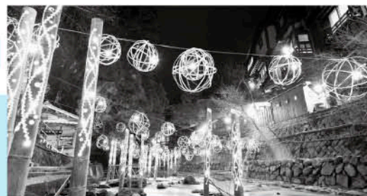
黒川温泉郷の湯明かり

基幹産業は、米作をはじめ、杉を中心とする林業、畜産業（あか牛、ジャージー牛）、高冷地野菜（きゅうり、ほうれんそう、大根）やりんご、なしの果実、しいたけ等が盛んです。黒川温泉をはじめとした5つの温泉地や、2つの川が合流する「夫婦滝」、阿蘇五岳を望める「押戸石の丘」などの絶景スポットにより年間約100万人の観光客が訪れています。