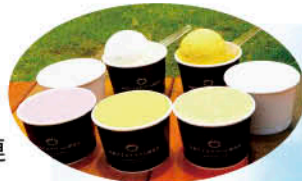
豊島大地の恵百姓市（豊味うどん横）にて販売しております。

一昨年、昨年、ご当地グルメコンテスト in まつり宮崎で2連覇を果たした高原アイスクリーム研究所。