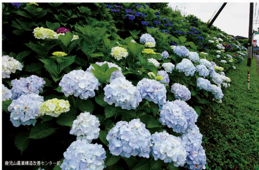
鹿児山農業構造改善センター前

「日本で最も美しい村」連合に加盟する高原町の景観の魅力が、町内全体の取組の中でますます充実してきました。