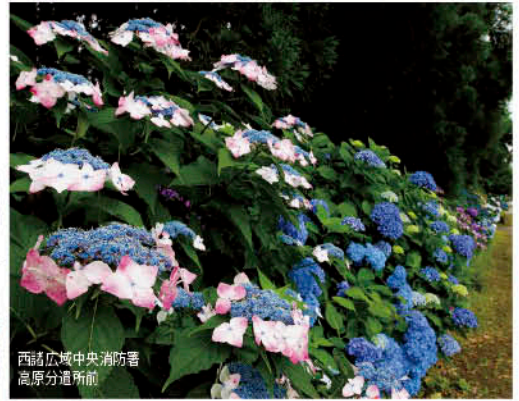
西諸広域中央消防署 高原分道所前