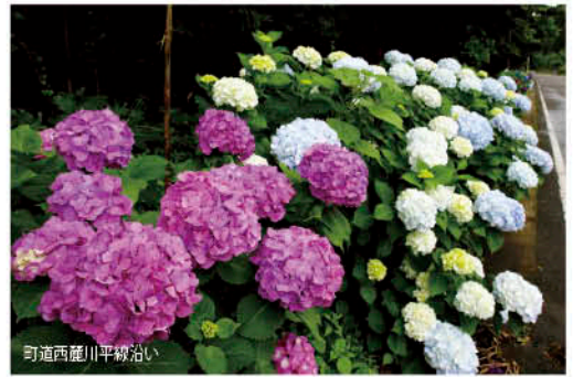
可道西麓川平線沿い