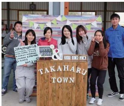
フォトブースを制作した高原町青年団協議会のメンバー