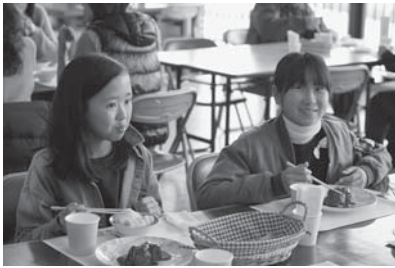
今年2月の同様のイベントの様子