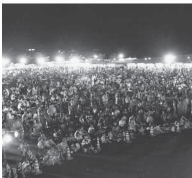
大勢の来場者で賑わう昨年のまつり高原