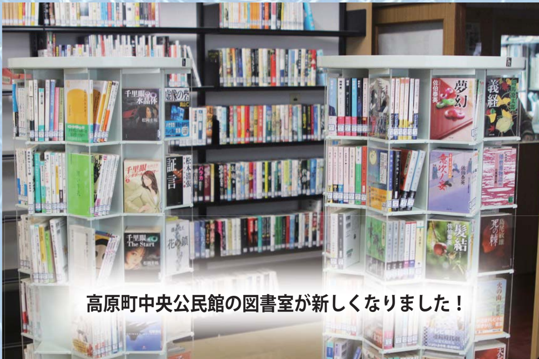
高原町中央公民館の図書室が新しくなりました！

また、この度のリニューアルを機に子育て支援図書も県立図書館からお借りする予定としておりますので、子育て世代の方々も是非お立ち寄りください。