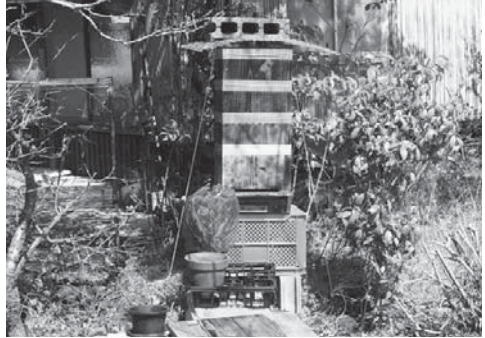
蜂の巣箱とキンリョウヘン

桜が散り始める頃になると、二ホンミツバチ達が分蜂します。この群れを自分の巣箱に住ませようと必死になるのですが、キンリョウヘンというランを使うと探索蜂を簡単に寄せることが出来ます。探索蜂は新しい営巣場所を探す役目を持っており、なぜかキンリョウヘンの花に引き寄せられます。不思議なもので普通に活動している働き蜂は、一切、キンリョウヘンには興味を持ちません。設置した巣箱の横に開花したキンリョウヘンを置いておけば、すぐに探索蜂がやってきて設置した巣箱を品定めし始めます。これに気が入ってくれば、晴れて二ホンミツバチの群れをお迎えることができるわけです。