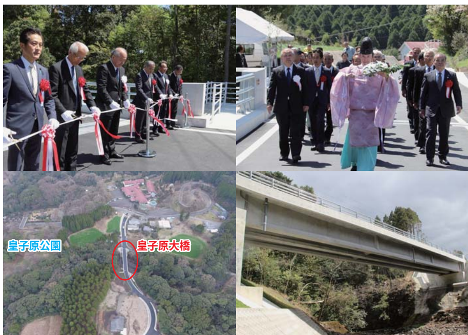
上空から見た皇子原大橋

今回の完成により、今後は住民のより一層の安全・安心な生活の確保と、地域の活性化および今後の観光道路としての発展が図られるものと期待したいと思います。