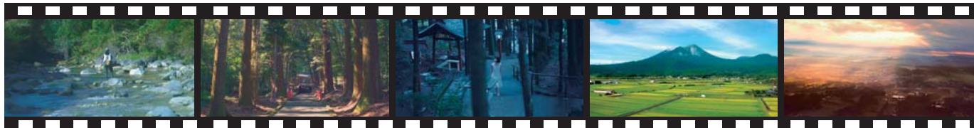
⑥フライフィッシングをする男性と高崎川で出会います。 ⑦狭野神社の参道に舞い降ります。 ⑧霧島東神社の参道を散策します。 ⑨中平から小塚にかけて上空を舞います。 ⑩ふるさと林道付近から町内を一望します。