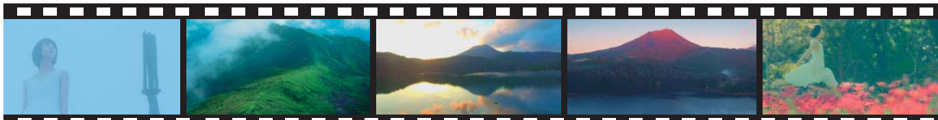
①高千穂峰に不思議な少女が舞い降ります。 ②高千穂峰の尾根をつたって降りていきます。 ③御池の水鏡に高千穂峰と夕日が映ります。 ④早朝、東の空の朝焼けに照らされ高千穂峰が赤く染まります。 ⑤ヒガンバナで赤く染まった皇子原公園を散策します。