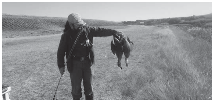
鴨猟の様子、命中した鴨の回収は大変です。

田舎暮らしはスローペースだなんていいですけど、僕にとっては1日が24時間では全然足りません。高原町で暮らし始めると、次々とやってみたくが増えました。まだまだ知らないことがありそうだと、今年もまたワクワクした生活になりました。