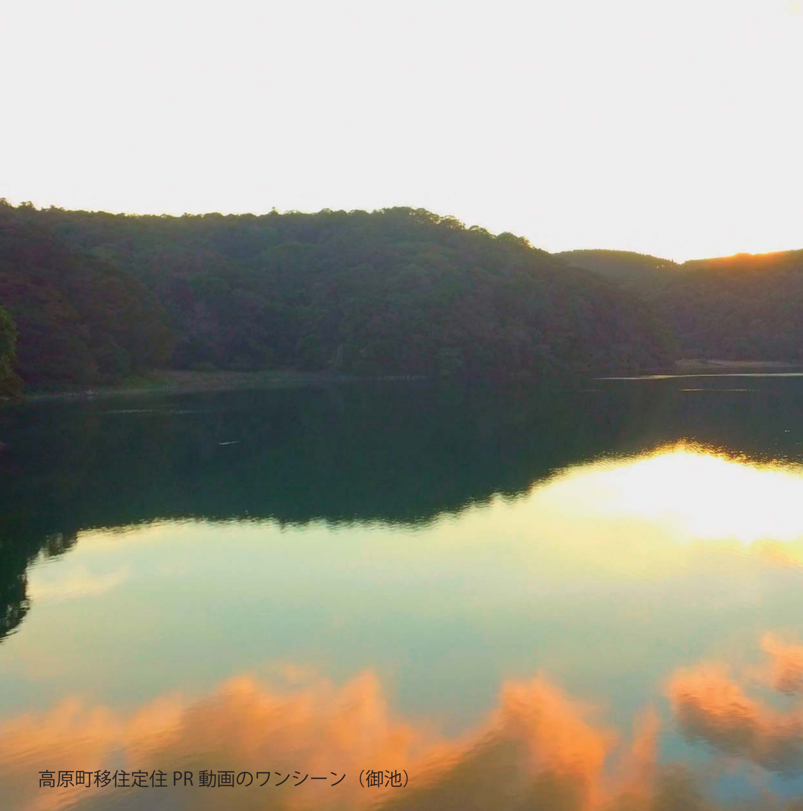
高原町移住定住 PR 動画のワンシーン（御池）