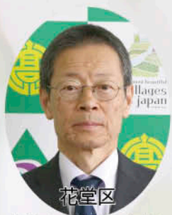
花堂区 村田 經典 区長