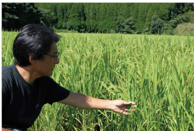
良食味の小清水米

田などを借りて、約8ヘクタールの水田で良食味米のヒノヒカリを栽培しており、その中で“小清水米”を栽培している。