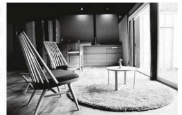
古民家ステイ「日月庵」

東洋文化研究者アレックス・カー氏（アメリカ）のプロジェクトのもと、古き良き日本の美をそのまま残し改修された小値賀島に点在する古民家を、一棟まるごと貸し切れる島暮らし滞在施設です。