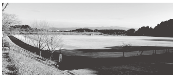
総合運動公園の周回コースは、1周約900メートルです。(約1,300歩)

「今回の事業に参加して意識が変わりましたか」という質問に多くの方が「変わった」と回答いただきました。高原町では今後も、町民の皆さんが進んで参加できて、なおかつ健幸になれる事業を行っていきたく考えています。また、こういった事業は、皆さんが参加して初めて成り立つものですので、奮ってご参加いただければ幸いです。