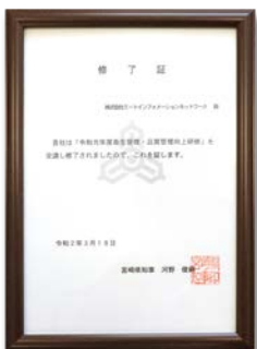
県の衛生管理修了証 食の安全・安心を追求している。