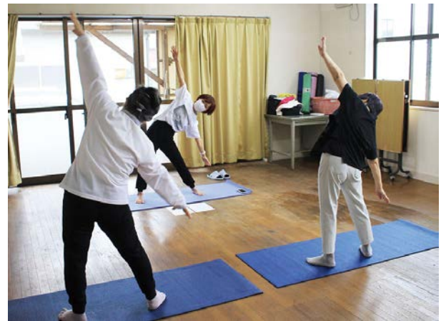
参加者の方に目を配りつつ、無理のない動きで進めていきます。

— そういった方々にもぜひ体感していただきたいですね。ヨーガ療法を通じてご自身が一番効果を感じたことは何だったのでしょうか？