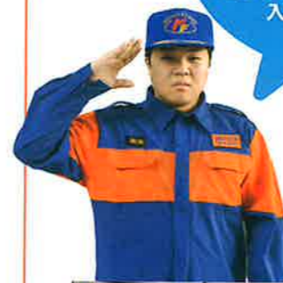
右) 夜警前の消防隊員 下) 昨年参加した 操法大会の様子

学生消防隊と聞くと堅い雰囲気を持たれるかも知れませんが、そんなことはまったくなく、楽しく活動しています。宮崎大学に進学される方はぜひ消防隊に入隊してください!