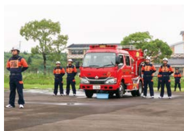
夏季点検(操法大会)