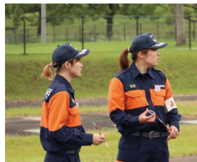
操法大会の補助を行う女性部団員