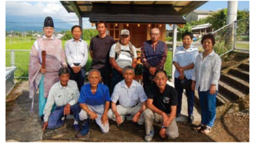
五助塚「馬登馬頭観音」

この馬頭観音は、馬登地区の馬頭観音として祀ることになって以来、春・夏地区民の手で草を刈り観音堂を清め、地区民や牛馬の無病息災を祈り、五穀豊穡、地区安全を祈願してきました。これからも、地域を見守る馬頭観音として大切に引き継がれていきます。