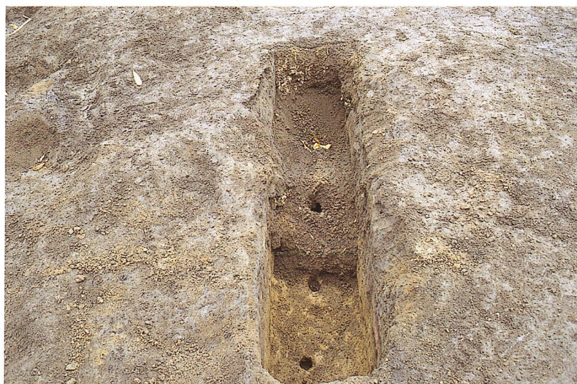
陥し穴埋土状況（B-1地区）