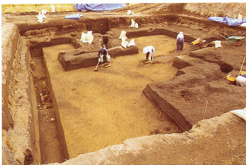
畝状遺構検出状況（B-2地区）