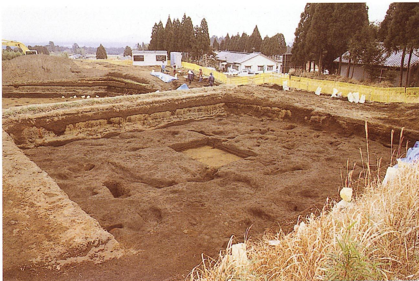
高原スコリア除去後状況（B-2地区）