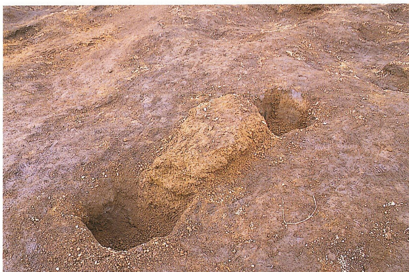
陥し穴検出状況（A地区）