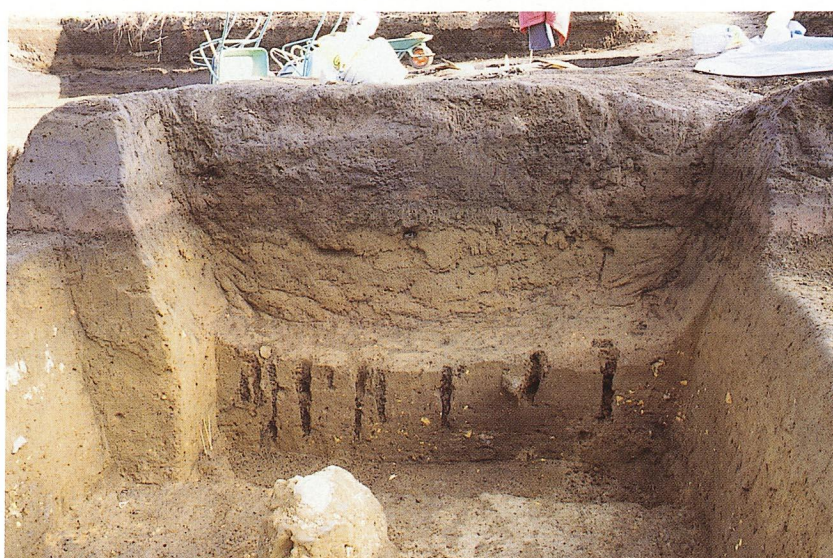
陥し穴断ち割り状況（B-2地区）