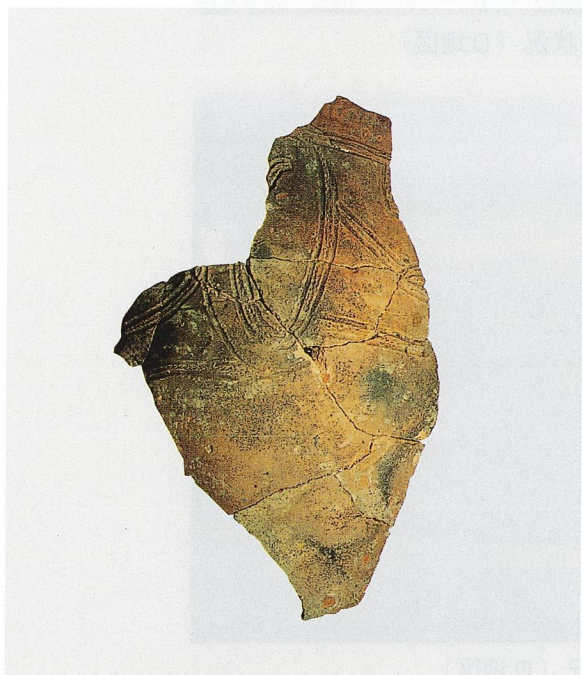
出土繩文土器 (C地区)