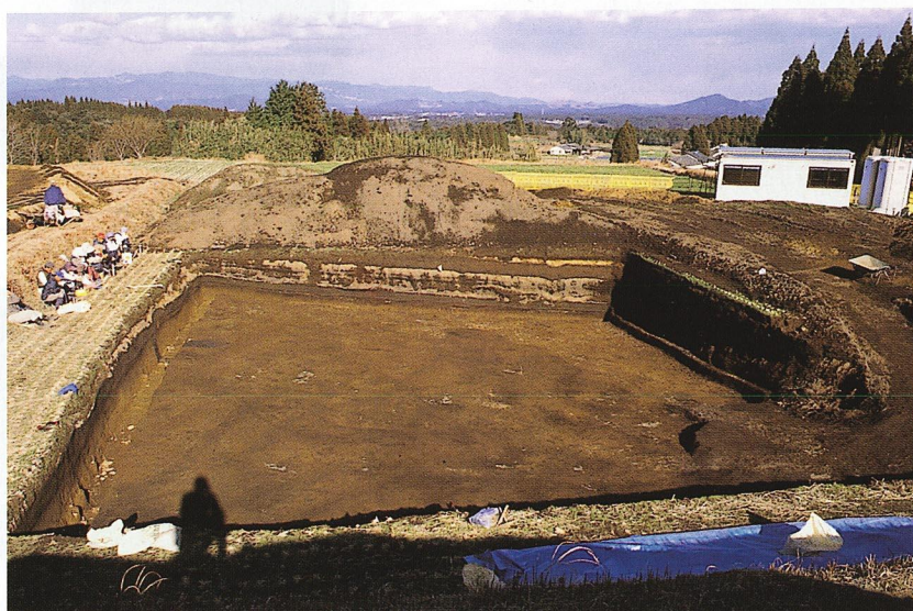
畝状遺構検出状況（D地区）