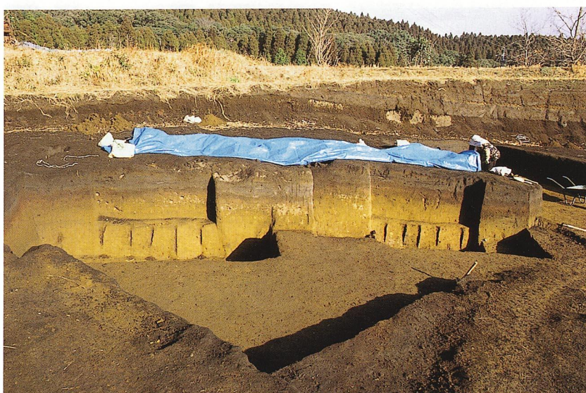
陥し穴断ち割り状況（A地区）