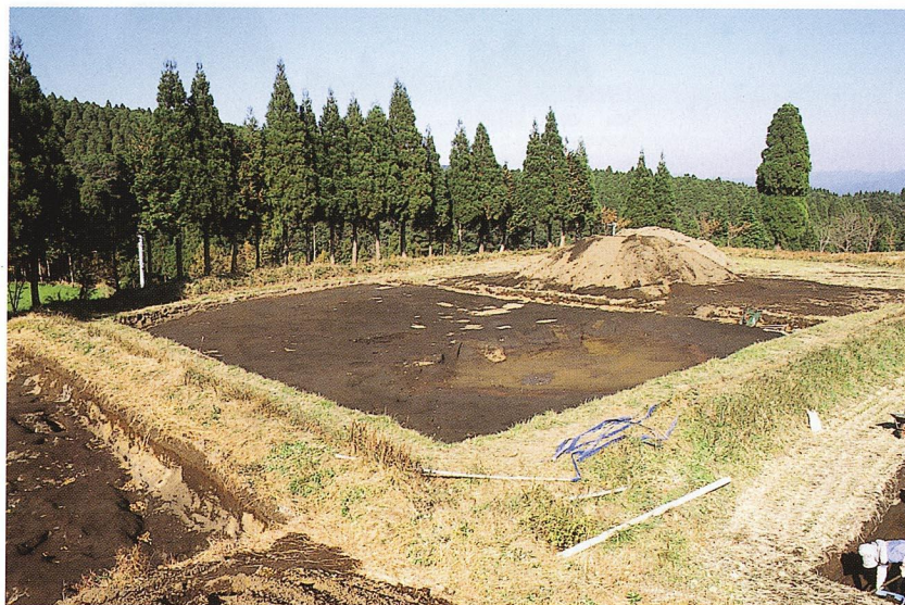
高原スコリア除去後状況（C地区）