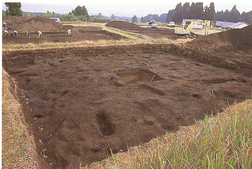
高原スコリア除去後状況（B-1地区）