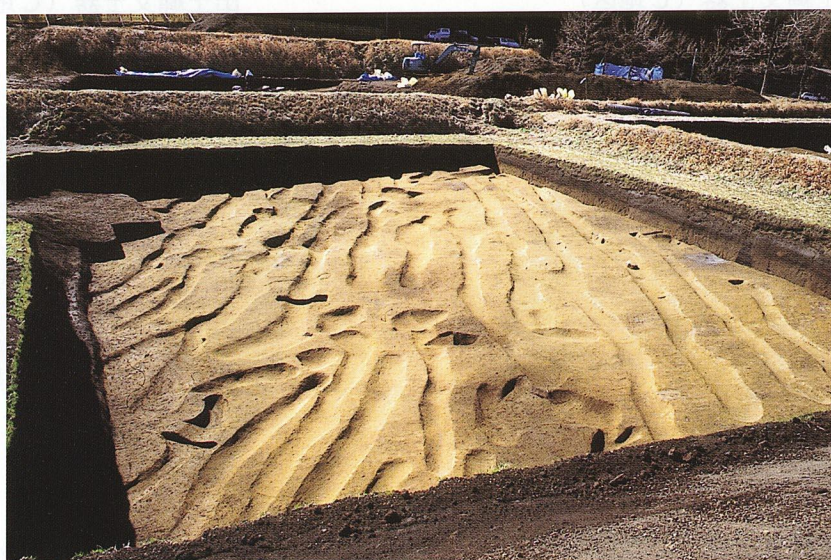
畝状遺構完掘状況（D地区）