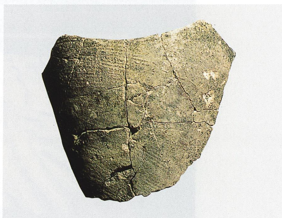
出土繩文土器 (C地区)