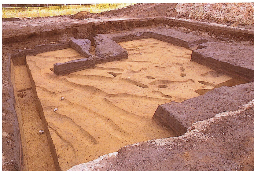
畝状遺構完掘状況（B-2地区）