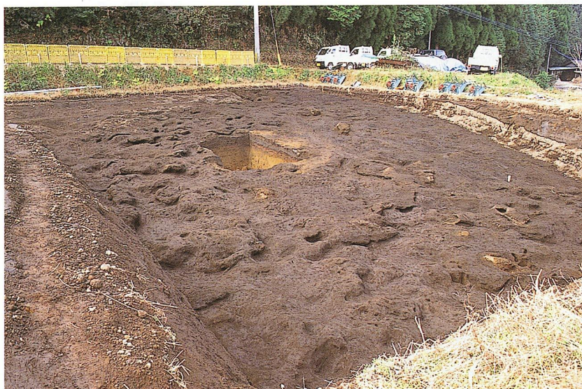
高原スコリア除去後状況（A地区）