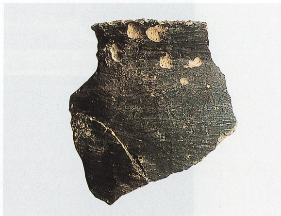
出土繩文土器 (C地区)