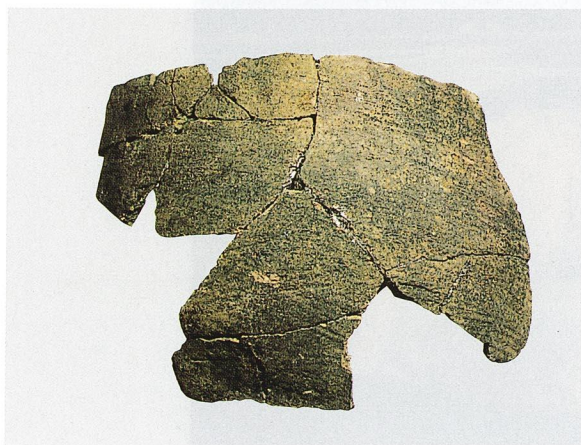
出土繩文土器 (C地区)