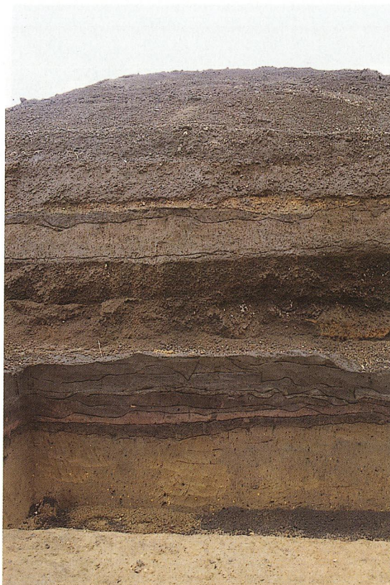
土層堆積状況（A地区）