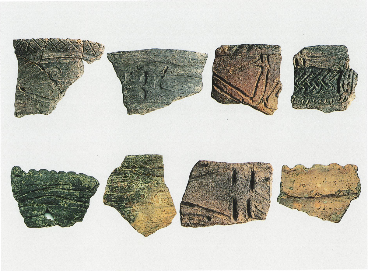
出土繩文土器 (C地区)