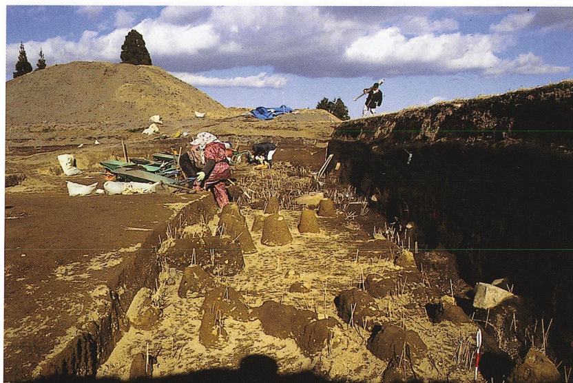
縄文土器出土状況（C地区）