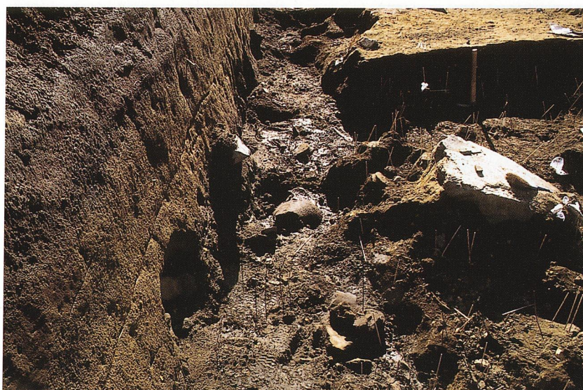
縄文土器出土状況（C地区）