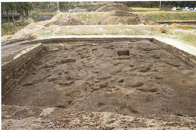
高原スコリア除去後状況（D地区）