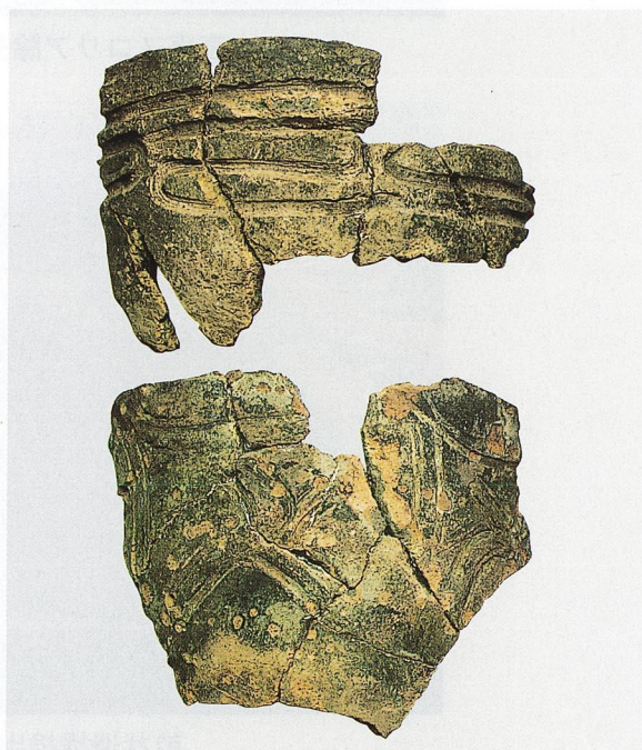
出土繩文土器 (C地区)