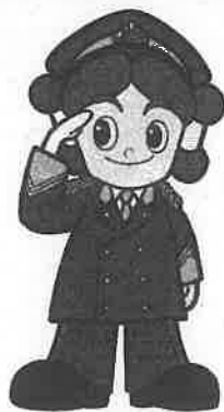
宮崎県警察シンボルキャラクター 「みやけいちゃん」 警察音楽隊制服バージョン