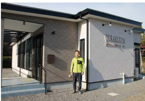
どなたでもお気軽にどうぞ。苦楽を共に、健康で幸せに!

なんでも自分でやらないと気が済まないというご自身の性格や、黙々とやる仕事よりは、人とのふれあいがある仕事をしたという和やかな気持ちがあつてこそ、今のお仕事に繋がっているんだろうなと感じました。誰しも健康であるに越したことはありません。まずは日々頑張ってくれている我が身に「ありがとう」と声をかけ、心身共に自分と優しく向き合ってみませんか? 身体が心なしに軽くなるかもしれませんよ。