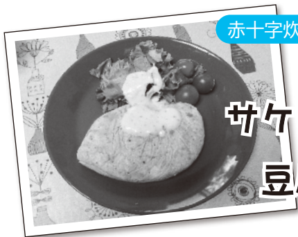
赤十字炊き出しレシピコンテスト 佳作入賞作品