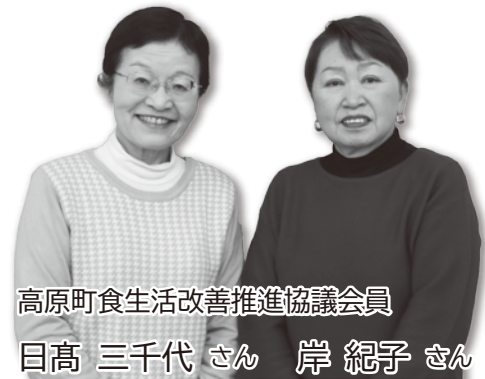
高原町食生活改善推進協議会員