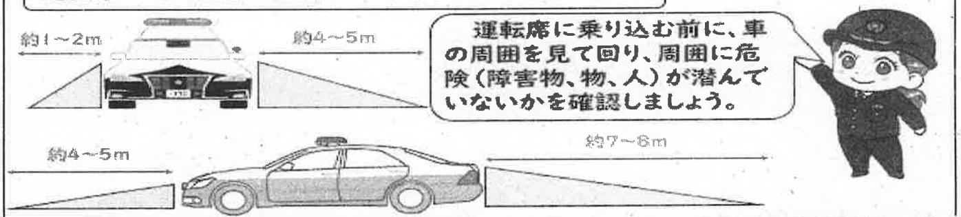
運転席からの死角の範囲イメージ図（セダン車の場合）

車の種類によって、死角の範囲は変化しますが、私たちが思っている以上に運転席からの死角は広範囲となっています。