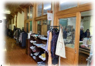
↑ フリーマーケット