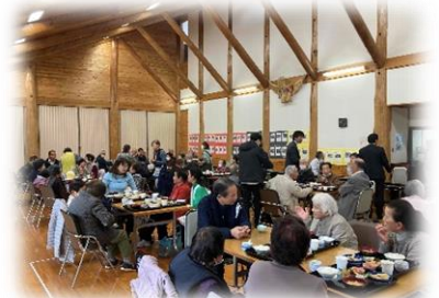
↑ コミュニティ食堂の様子