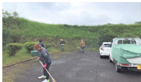
昨年6月に役員で施設の清掃・除草作業を行いました。 早朝よりお疲れ様でした。