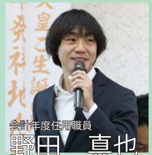
会計年度任用職員

今後も多様な関係者と連携しながら、地域の魅力を高める取り組みに挑戦していきます。