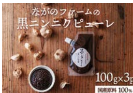
合同会社ながのファーム 黒にんにくピューレ