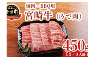
株式会社ミートインフォメーションネットワーク宮崎工場 宮崎牛ウデ肉 (焼肉用)