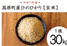
上野駿 高原町産ヒノヒカリ玄米 30kg