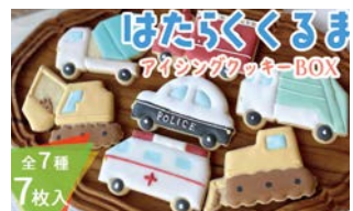
有限会社クリンシア はたらくるまアイシングクッキー