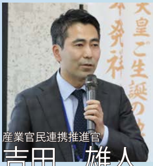
産業官民連携推進官

令和3年から官民連携の手法で高原町の地域活性化に取り組んできました。民間企業のノウハウを活かしながら地域商社の設立を支援し、ふるさと納税で稼げる土台を作りました。また『企業版ふるさと納税』という制度を使って、町外の企業からの寄付を集め（令和7年度は約2700万円）、新たな財源確保の道を開きました。さらに、町外の企業に高原のサポーターになってもらうための取り組みを進めるため『企業版関係人口づくり推進協議会』という団体を立ち上げ、約70社に加盟いただいています。官民連携を通じて、高原町がもっと元気になるよう、これからも取り組みを続けていきます。