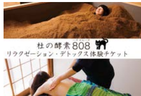
杜の酵素 808 デトックス体験