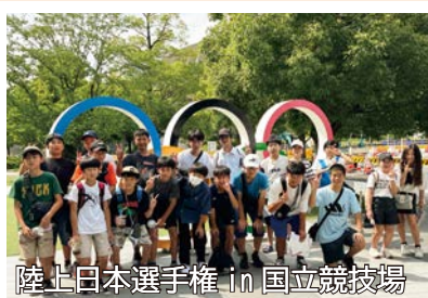
陸上日本選手権 in 国立競技場