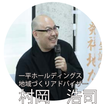
一平ホールディングス 地域づくりアドバイザー

私自身、この町に通う中で『はじまりの地』という言葉が浮かびました。神話が歴史へとつながる場所、水が命を育む場所。そうした意味を持つこの町の価値を、今後さらに深めていきたいと考えています。