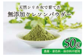
株式会社水寿 クレソンパウダー