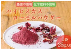
ローゼルユカリの里 ハイビスカスローゼルパウダー