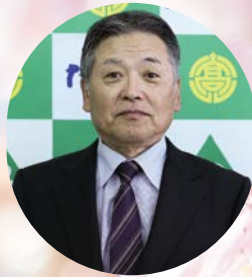
下広原区長 末山 淳一