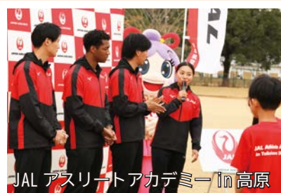
JAL アスリートアカデミー in 高原