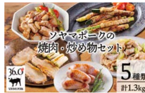
株式会社曾山養豚 ソヤマポークの焼肉・炒め物用セット