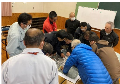
↓ 被害場所を書いている様子

後川内地区の地図に、イノシシ被害の場所を書き込み、防護柵をどこに設置した方がいいかを話し合いました。参加者からは農地集積など、今後を見据えた話もでてきました。今後、防護柵に関係する地権者への説明などに取り組んでいきます。