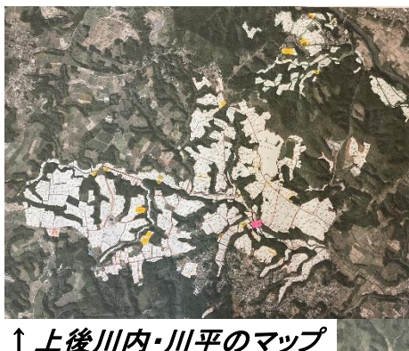
↑ 上後川内・川平のマップ